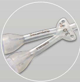
Catéter doble lumen para la infusión de soluciones incompatibles.