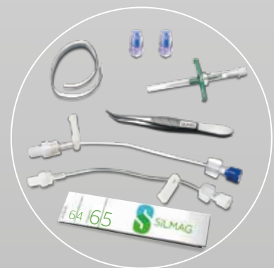
El set incluye: cinta métrica descartable, pinza metálica, lazo hemostático de silicona, introductor pelable, prolongador y conector needle-free.