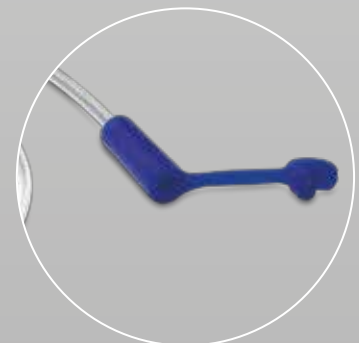
Versión con tapa (cód. 392)