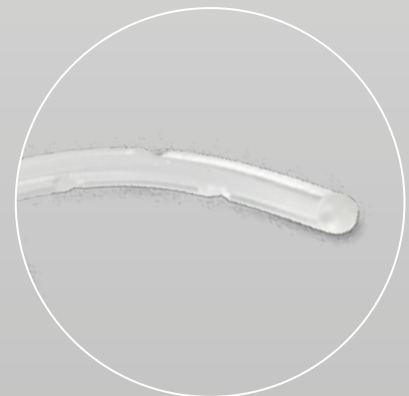
Extremo cerrado y redondeado.

100% silicona transparente con línea radiopaca.