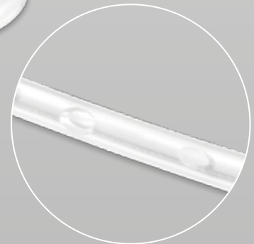
5 orificios laterales.

100% silicona transparente con línea radiopaca en toda su longitud.