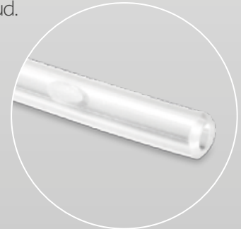
Extremo abierto redondeado.