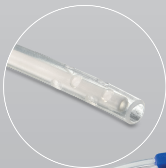
Extremo abierto y redondeado.