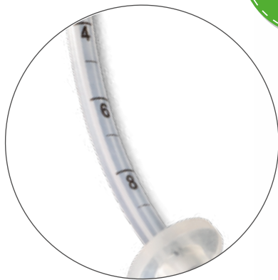
Marcación por centímetro.