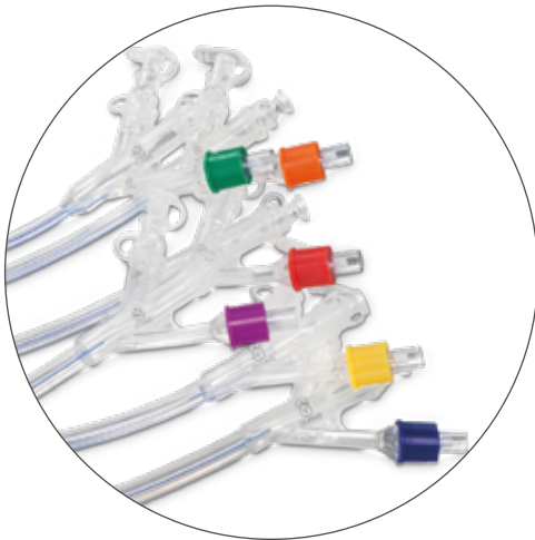
Gran variedad disponible de calibres.