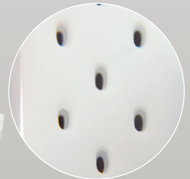
Sección plana "multiperforada".